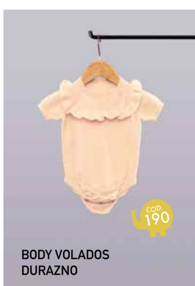
BODY VOLADOS DURAZNO