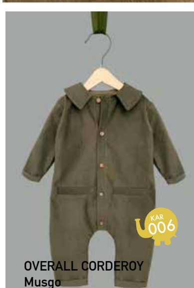
OVERALL CORDEROY Musgo