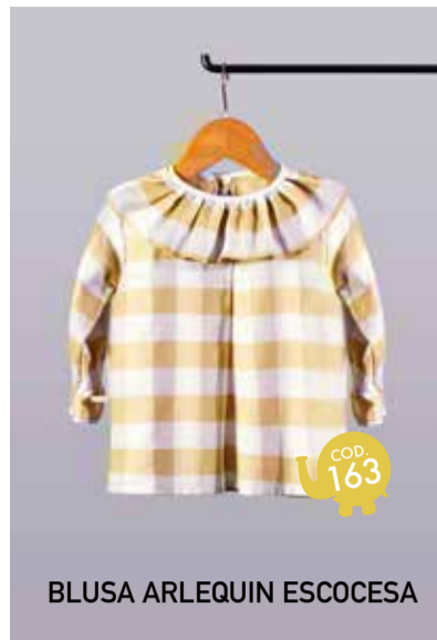
BLUSA ARLEQUIN ESCOCESA