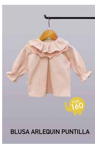
BLUSA ARLEQUIN PUNTILLA