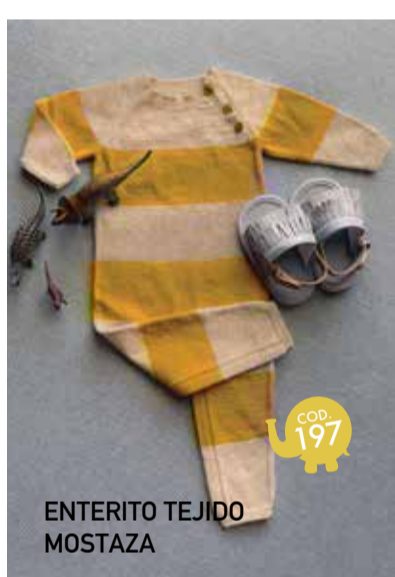
ENTERITO TEJIDO MOSTAZA