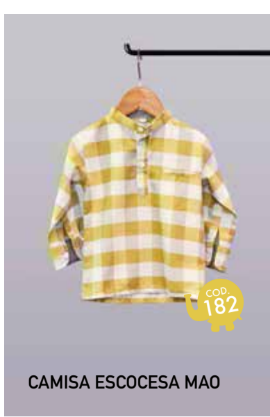
CAMISA ESCOCESA MAO