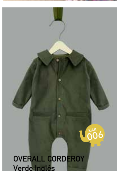
OVERALL CORDEROY Verde Inglés