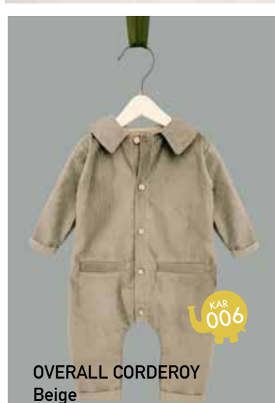
OVERALL CORDEROY Beige